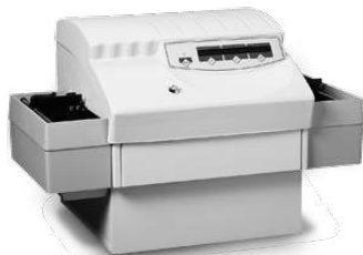
Máy dập nổi