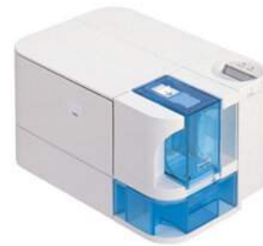
Máy in Nisca - Japan