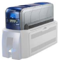
Máy in Entrust - USA