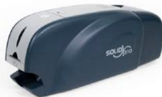
Máy in Solid - Korea