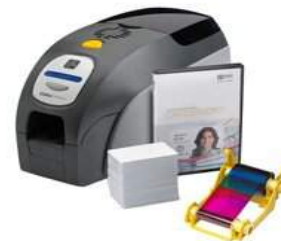
Máy in Zebra - USA